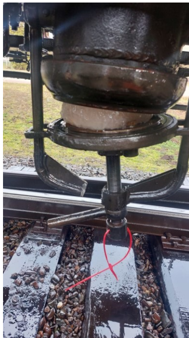
Фото 1 – Ледяная пробка в нижнем сливном приборе вагона № 73125379.

Убедившись в отсутствии пролива, осмотрен нижний сливной прибор (далее – НСП). При осмотре выявлено: откидная крышка НСП приоткрыта на 60-70мм, при этом выявлено наличие ледяной пробки (фото 1) соответствующей диаметру НСП, также обнаружен свежий излом скобы НСП.